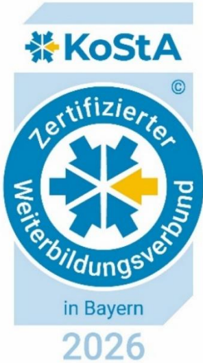
WBV Allgemeinmedizin Freising