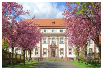
Krankenhaus für Psychiatrie, Psychotherapie und Psychosomatische Medizin des Bezirks Unterfranken

Krankenhaus für Psychiatrie, Psychotherapie und Psychosomatische Medizin des Bezirks Unterfranken Am Sommerberg 97816 Lohr am Main www.bezirkskrankenhaus-lohr.de